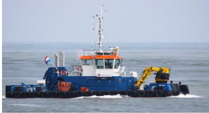
Vessel - SAFEEN DIVETECH 1